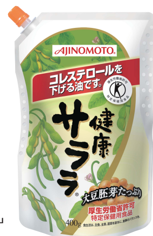
「AJINOMOTO 健康サララ」 (400gUDエコパウチ)