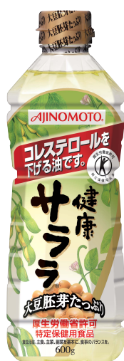
「AJINOMOTO 健康サララ」 (600g)