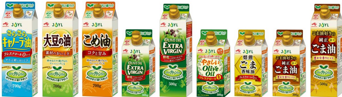
「スマートグリーンパック®」シリーズ

「スマートグリーンパック®」シリーズは、プラスチック廃棄物や CO 2 排出量の削減を推し進めるため、油脂製品では珍しい紙パック（森林認証紙）を容器に採用し、包装機能と環境対応を追求したシリーズです。家庭用製品は 2021 年 8 月に 2 製品を販売開始し、2022 年春にシリーズ化、その後もラインナップの充実を図っています。