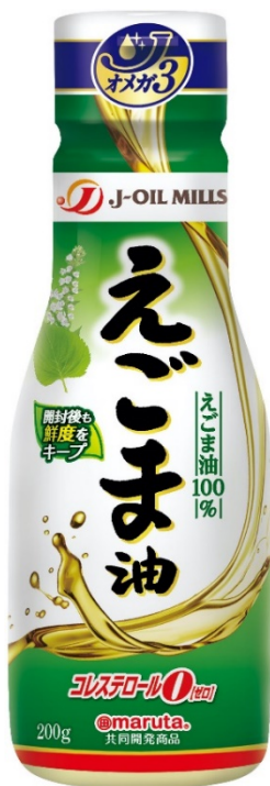
「オメガ3」シリーズ 「J えごま油」 200g 鮮度キープボトル

https://www.j-oil.com/oil/type/fa/#omega3