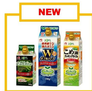
「スマートグリーンパック®」シリーズ