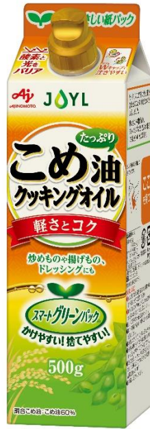
JOYL「AJINOMOTO こめ油たっぷりクッキングオイル」500g スマートグリーンパック®